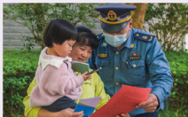
松溪路政员向社区居民宣传路政知识