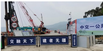
浒屿特大桥建设工地门禁系统

项目秉承“让每一个工点更安全”的理念，坚持将“智慧工地”融入到生产管理中，从施工准备阶段到工程交付使用，以可视化、信息化、数据化以及可视化的