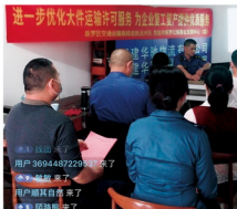
新罗：5月10日“大件运输许可”路政课堂”网络直播

进大件运输小课堂直播间，结合“护航大件运输平安路”宣传，通过政策解读培训、座谈了解企业需求、大件运输审批现场核查等直播环节，进一步增进公众对大件运输以及大件运输许可服务工作的了解。直播吸引了1.2万余人观看，留言互动热烈，拉近公路部门与企业的距离，搭建沟通交流互动平台。龙岩公路部门走进校园和大件运输企业开设“路政课堂”，并同步在抖音平台进行直播，让更多的企业和群众参与进来，共同了解公路相关法律法规，营造爱路护路、遵守公路法律法规的社会氛围。宁德公路部门突破传统宣传方式，邀请评书艺人通过周宁方言讲解《民法典》《公路法》等法律相关知识，深入浅出的说明、生动的肢体语言，在抖音播出后受到当地群众的热烈欢迎。