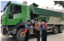
安溪路政人员在澳江公路服务区司机之家向过往货车司机分发宣传册

全省普通公路部门全面收集涉及宣传主题的《中华人民共和国公路法》、《公路安全保护条例》及《超限运输车辆行驶公路管理规定》等公路法律法规的条文解读、经典案例，编纂成富有感染力的图文资料和精美宣传手册，在国道沿线、公路服务区、停车区、路政文化园、路政服务大厅、养护站班等进行全路域宣传。开展“三走进”宣传活动，并将宣传触角延伸至沿线景区、驾