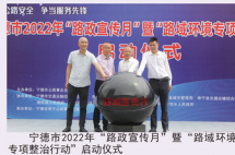
宁德市2022年“路政宣传月”暨“路域环境专项整治行动”启动仪式

全省普通公路路部门紧密结合路域环境整治工作的宣治并举,着力实现交通运输部门提出的路域整治“八个无”目标。宁德公路路部门开展“路政宣传月”暨“路域环